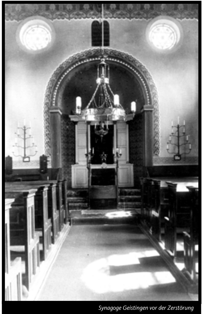
Synagoge Geistingen vor der Zerstörung