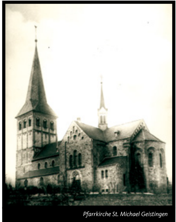
Pfarrkirche St. Michael Geistingen

1075 Seit etwa 1075 besitzen das Cassiusstift und die Abtei Siegburg die Kirche in Geistingen je zur Hälfte. 1065 bis 1075 wird die Kirche in Geistingen („ ecclesie que est in Geystingin “) genannt. Im 11. Jahrhundert befindet sich die Hoch- und Blutgerichtsbarkeit im Bann Geistingen in der Hand des Pfalzgrafen. Sie gingen später an die Grafen von Sayn über. 1075 wird die Kirche in Hennef („ in Hanafo “) und damit die Siedlung erstmals genannt.