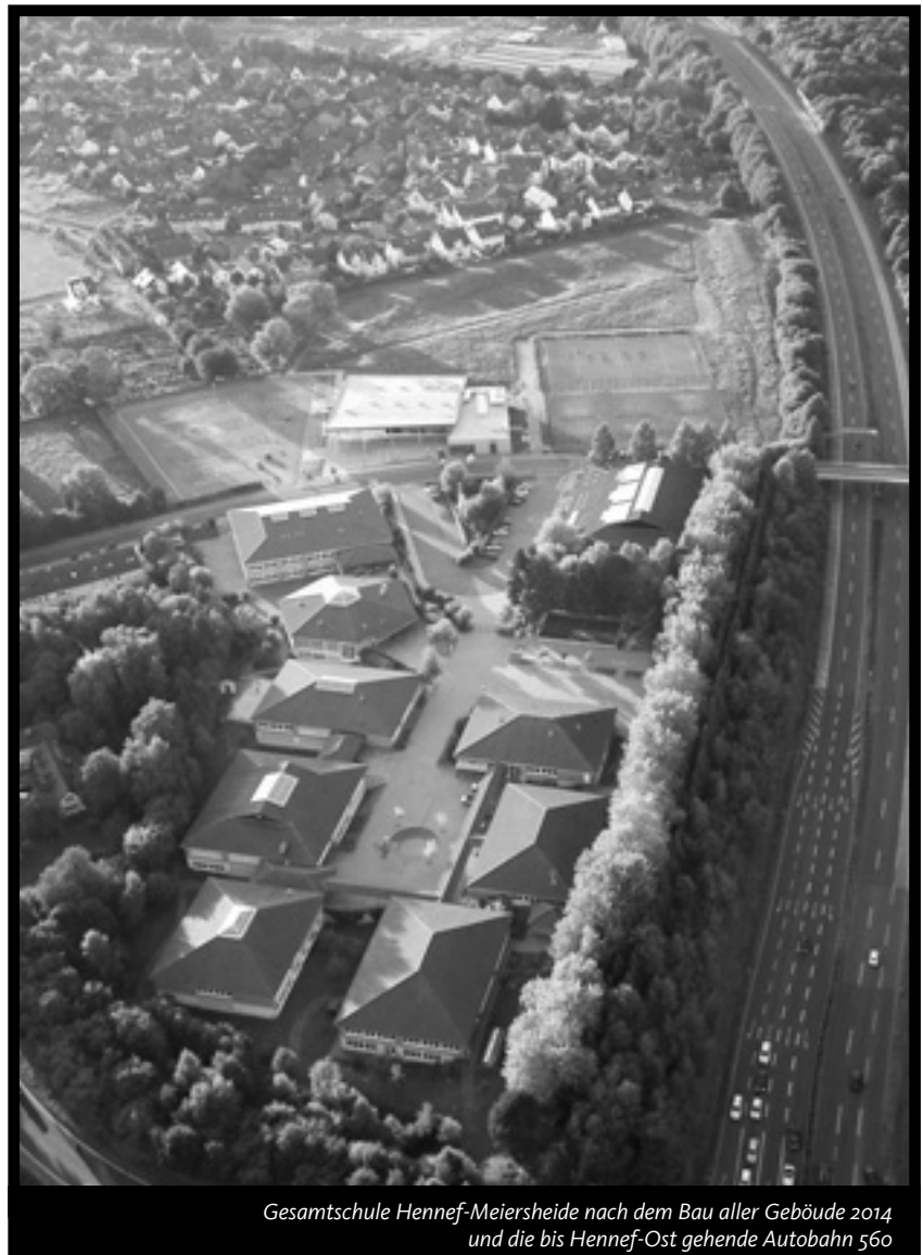
Gesamtschule Hennefer-Meiersheide nach dem Bau aller Gebäude 2014 und die bis Hennefer-Ost gehende Autobahn 560