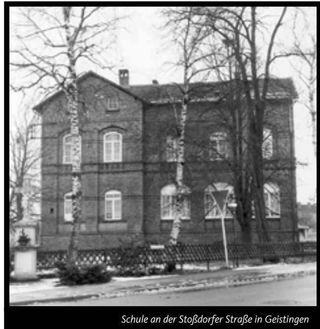
Schule an der Stoßdorfer Straße in Geistingen

1897 Stiftung eines Grundstücks und 10.000 Mark zur Errichtung einer Fortbildungsschule durch Carl Reuther, eröffnet 1899 unter dem Namen „Gewerbliche Fortbildungsschule der Carl-Reuther-Stiftung“, später (nach 1923) umbenannt in „Berufsschule der Carl-Reuther-Stiftung“; 1934 Zweckverbandsberufsschule.