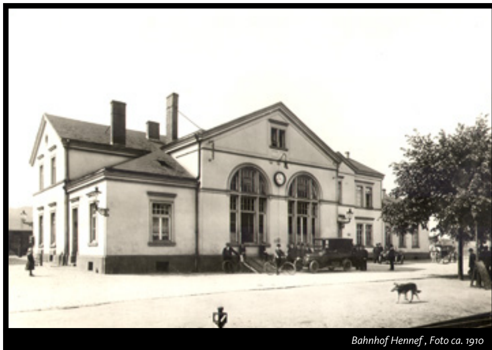
Bahnhof Hennef, Foto ca. 1910