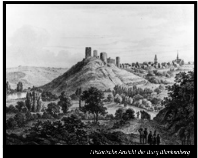
Historische Ansicht der Burg Blankenberg

1181 Burg Blankenberg wird erstmals als „ castrum quod Blankenburg dicitur “ („ Burg, die Blankenburg genannt wird “) erwähnt. Die Brüder Graf Heinrich II. und Graf Everhard II. von Sayn haben sie auf einem Allod der Abtei Siegburg als Stützpunkt ihres ausgedehnten Grundbesitzes errichtet („Allod“ ist im Gegensatz zum „Lehen“ volles Eigentum, ein Lehen dagegen lediglich nutzbares Eigentum).