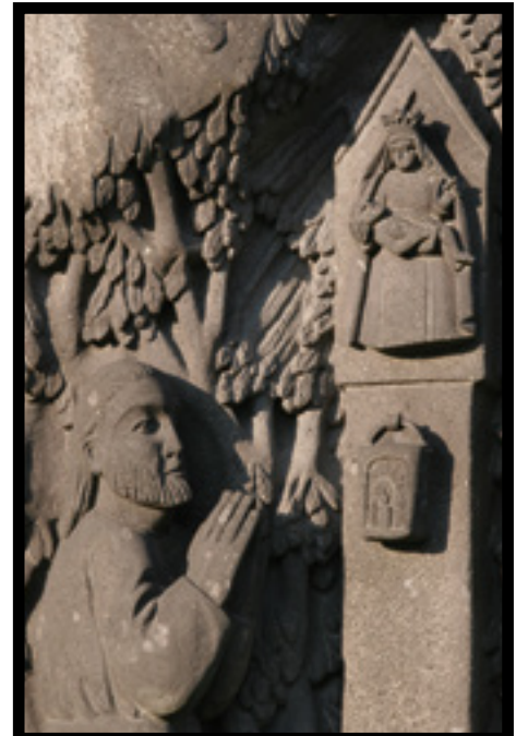
Darstellung der Marienlegende vor der Bödinger Kirche

1568 Der Landesherr bewilligt vier weitere Jahrmärkte in der Stadt Blankenberg.